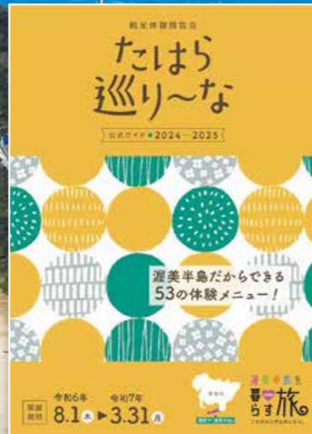
観光体験博覧会 たはら巡り~な