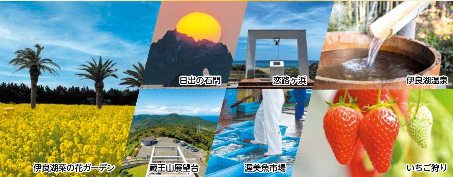
伊良湖菜の花ガーデン