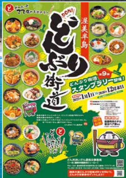
渥美半島どんぶり街道