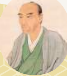
渡辺華山像 (部分) 椿椿山筆