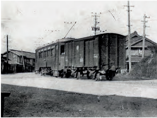
道路上を走る渥美線 小池・師団口(現在の愛知大学前)間 1930(昭和5)年ごろ 元写真は豊橋アーカイブス蔵