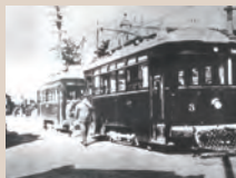
開業当時の市内電車