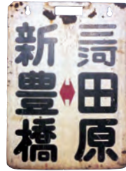
行き先方向板 〔個人蔵〕