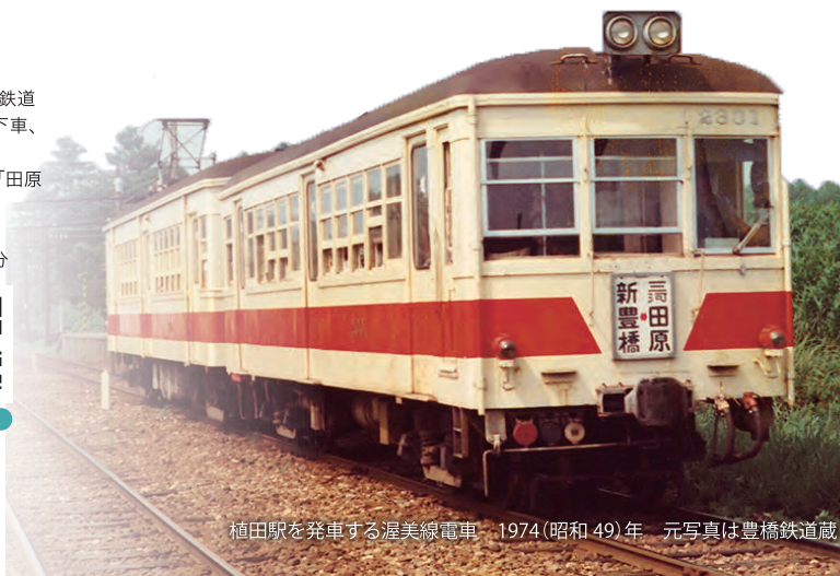
植田駅を発車する渥美線電車 1974(昭和49)年

また、90年前に計画された半島の先端まで建設するはずだった「まぼろしの渥美線」の過去と現在も取り上げます。この展覧会によって、お客様に地域の鉄道の新たな一面を発見する機会にしていいただければ幸いです。