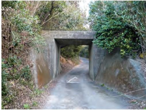
国による渥美線建設工事の遺構である石神町に残るコンクリート橋 現在