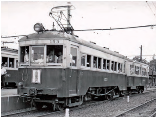
高師駅に停車中の渥美線電車 1960(昭和35)年ごろ 元写真は豊橋鉄道蔵