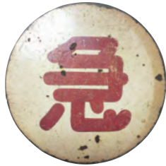
急行マーク(列車種別標) 〔個人蔵〕