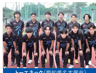
トーエネック(愛知県名古屋市)