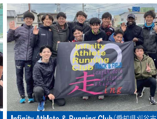
Infinity Athlete & Running Club(愛知県刈谷市)