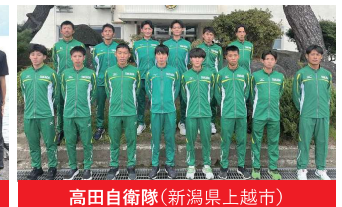
高田自衛隊(新潟県上越市)