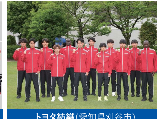
トヨタ紡織(愛知県刈谷市)