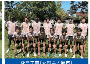
愛三工業(愛知県大府市)