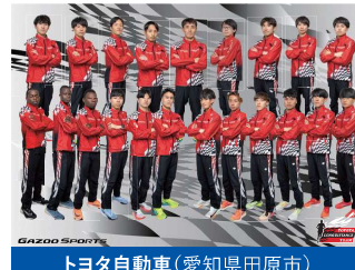
トヨタ自動車(愛知県田原市)