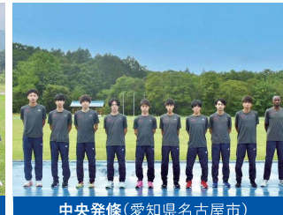
中央発條(愛知県名古屋)