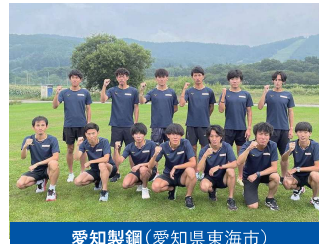
愛知製鋼(愛知県東海市)