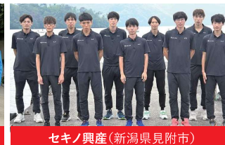
セキノ興産(新潟県見附市)