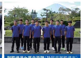
御殿場滝ヶ原自衛隊(静岡県御殿場市)