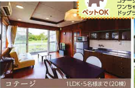
コテージ 1LDK・5名様まで(20棟)

ワンちゃんと一緒に泊まれる！ コテージ20棟のうち11棟は、ワンちゃんと一緒に泊まれます。ドッグランもございます！ ペットOK