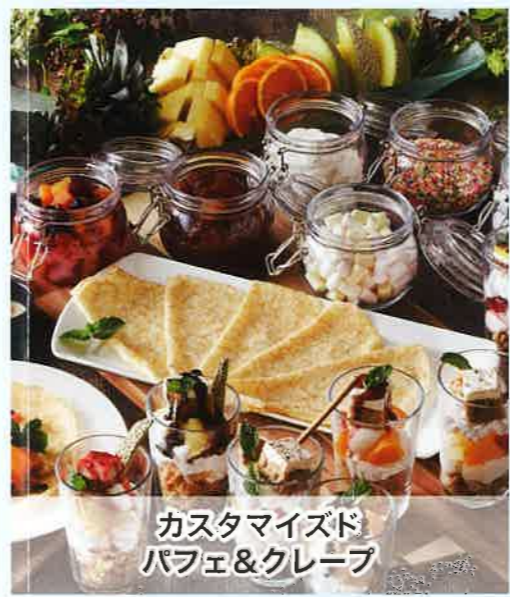
カスタマイズド パフェ&クレープ